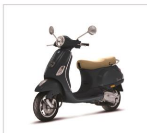
SKUTER VESPA LX 50 2T