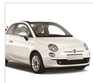
FIAT 500 POP