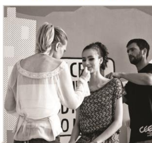
PRZYGOTOWANIE DO PRACY W MEDIACH