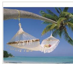
Voucher podróży na kwotę 10 tys.