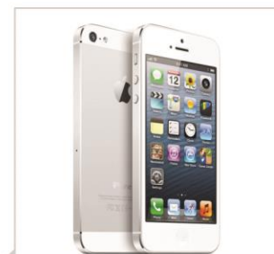
iPhone 5 BIAŁY 16GB